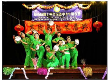
Yan hua Performance Team