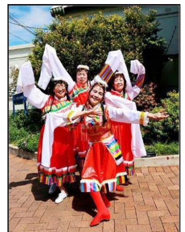
National Dance Team: